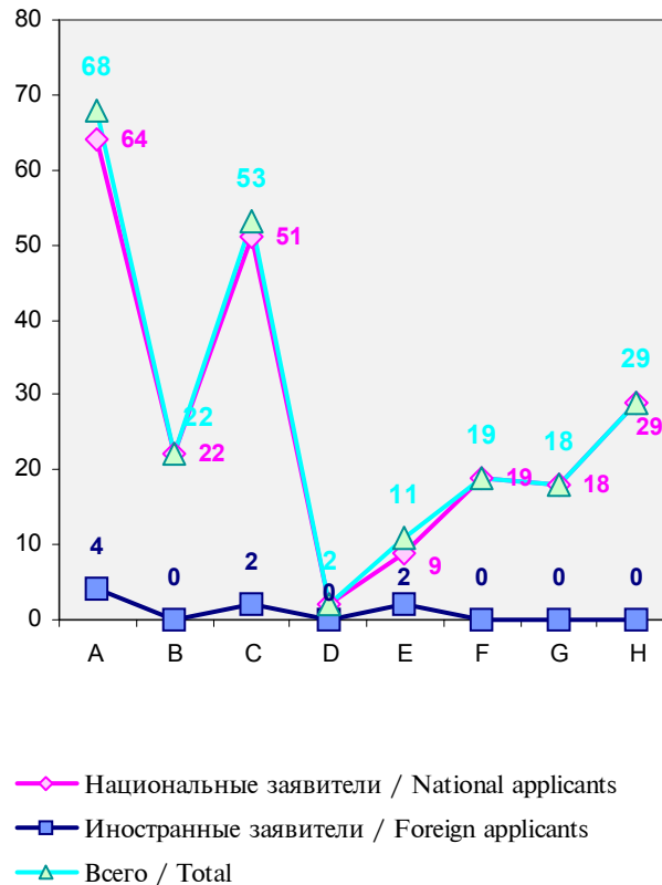
Рис. 1 / Fig. 1

In 2002 the number of international applications received from the national applicants consisted of 4.