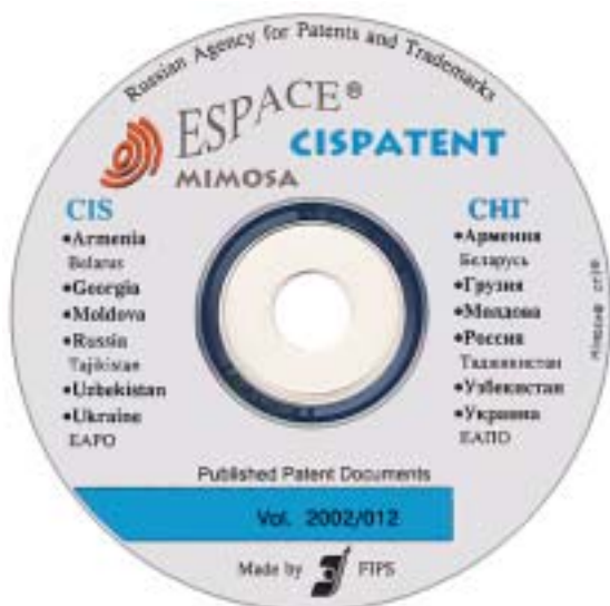
Рис. 5 / Fig. 5

Приобретено 22 компьютера типа Pentium 4, а также различные другие обслуживающие оборудования. С целью переоснащения программной системы агентства приобретены также программные лицензионные пакеты.