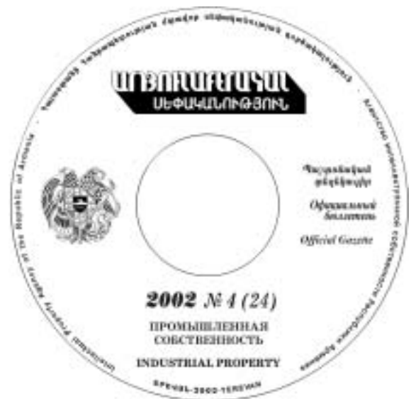
Рис. 4 / Fig. 4

The Agency continued works on replenishment funds of Armenian Scientific Technical Centre. Information received from foreign patent offices and 2 computers Pentium-200 were transferred to the Centre.